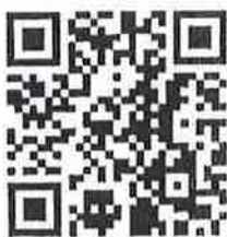
เทปบันทึกภาพการบรรยาย