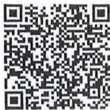
วิธีการสมัคร Line กบข.