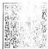
เอกสารสิ่งที่ส่งมาด้วย ๒