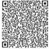
คำสั่งสำนักนายกรัฐมนตรี ที่ ๒๒๙/๒๕๖๖