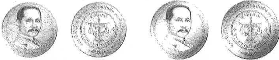
ชนิดเหรียญทองแดง ประเภทธรรมดา ขนาดเส้นผ่านศูนย์กลาง ๓๐ มิลลิเมตร