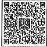
เอกสารสิ่งที่ส่งมาด้วย ๑